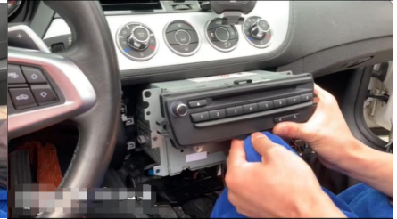
6. Achten Sie darauf, den Griff nicht zu verkratzen.