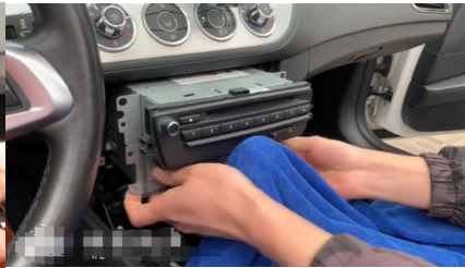
5. Entfernen Sie die Radio-Haupteinheit.