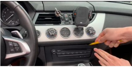
1. Entfernen der äußeren Radioblende/Zierleiste.