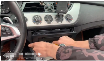
2. Entfernen Sie die äußere Zierleiste.