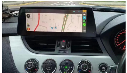
9. Installationsabschluss - Ergebnisansicht (Beispielfoto).