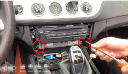
4. Entfernen Sie die Schrauben der Haupteinheit.