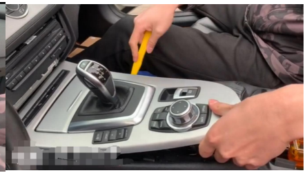
3. Schalthebel/Schaltknauf demontieren.